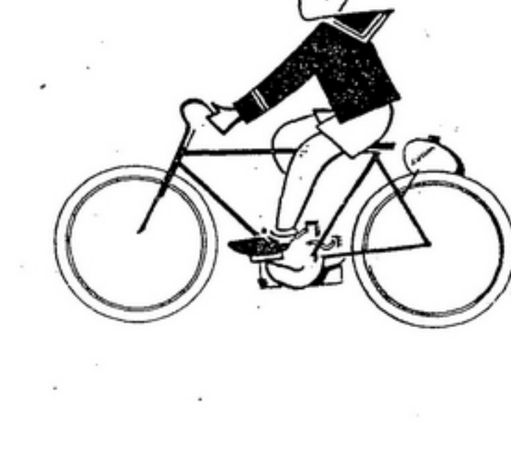
Per comprendere questo successo...