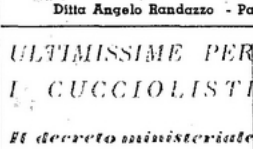
Ditta Angelo Rendazzo - Palermo - via Ruggero VII, 31.